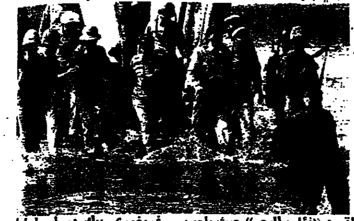
لقطة من (الغراب البحر) حيث يلعب غريغوري بيك دوراً بطولياً ..

من الابتكار لفته يفتقر الى الوسائل .. بريد هنا تقديم دراسة نفسية واجتماعية لشخصيته الرئيسية ، مع اجابات متخللة من الفيلوجينات اليونانية القديمة في مجله يعد الفيلم صلحا للمروسي التجارية حيث شبه من الجنس وشبهه من العنف يقم تسيوفه .. لكن هذا ليس من صالح رغبات المخرج الذي يريد منا ان نلخذ الفيلم جيداً